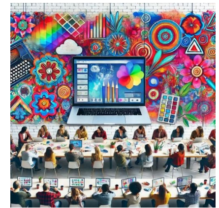
Digital ART Service Mikizzaner by DieMAxxo

Hotel Braun Hauptplatz 36 8570 Voitsberg www.hotel-braun.at