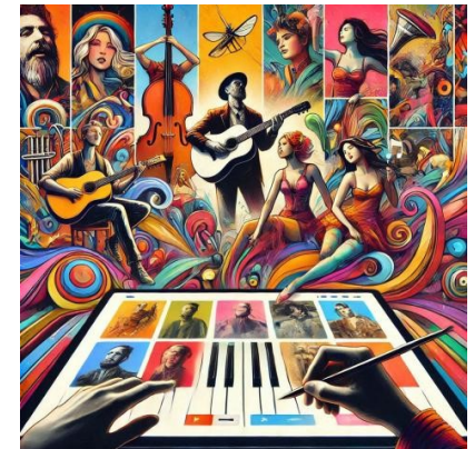
Digital ART Management Mikizzaner by DieMAXxo