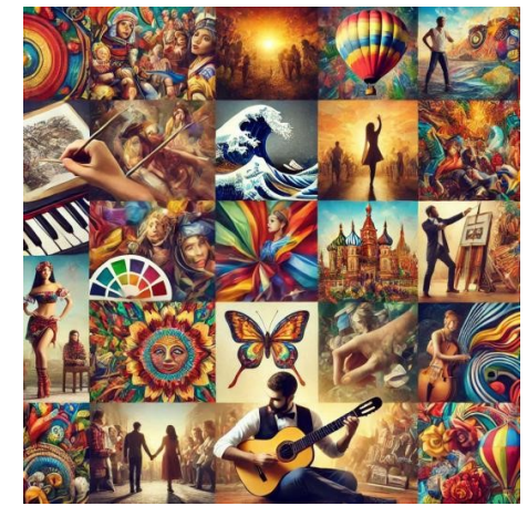
Digital ART BILDRECHT by DieMAXxo

Gemeinsam können wir die Kunstwelt bereichern und unsere Werke erfolgreich schützen!