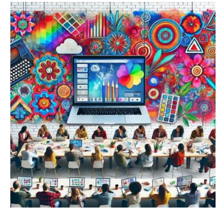
Digital ART Service Mikizzaner by DieMAxxo

Anfragen ab sofort möglich unter: anmeldung@mikizzaner.at