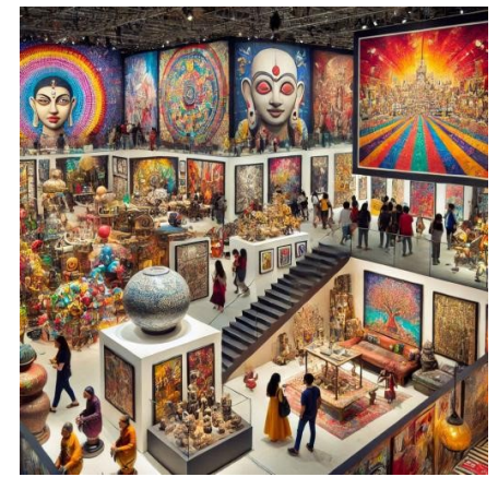
Digital ARTFACT's Mikizzaner by DieMAxxo

Katalogisierung: Katalogisiere alle Werke und erstelle einen Katalog oder eine Präsentation, um deine Kunst professionell darzustellen.