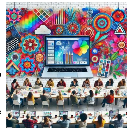
Digital ART Service Mikizzaner by DieMAxxo

Anfragen ab sofort möglich unter: anmeldung@mikizzaner.at