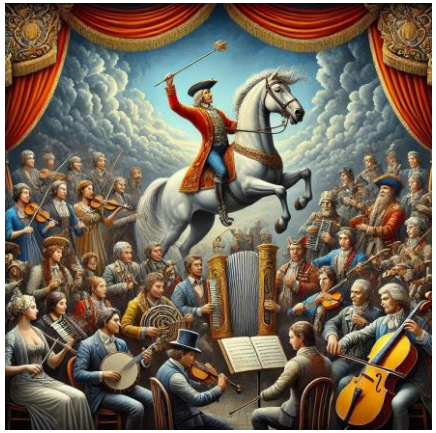
Digital ART Mitgliedschaft Mikizzaner by DieMAXxo

Mitglieder genießen viele Vorteile und Ermäßigungen.