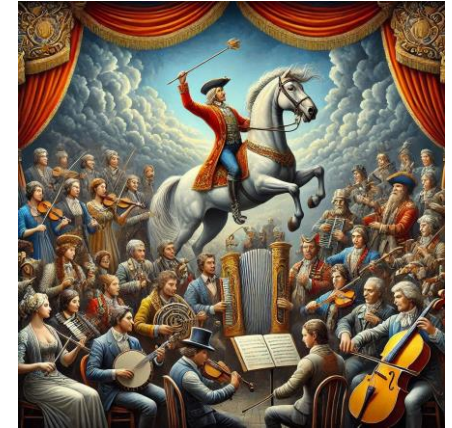
Digital ART Mitgliedschaft Mikizzaner by DieMAxxo

Kontakt unter: anmeldung@mikizzaner.at – Ein Antrag auf Mitgliedschaft wird jederzeit gerne zugesendet