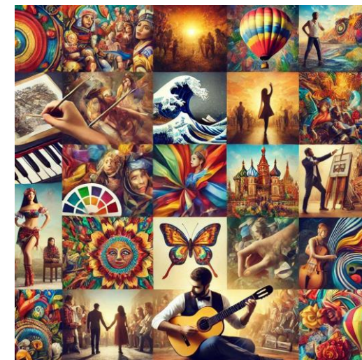
Digital ART BILDRECHT by DieMAxxo

Gemeinsam können wir die Kunstwelt bereichern und unsere Werke erfolgreich schützen!