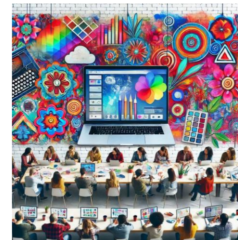
Digital ART Service Mikizzaner by DieMAxxo

Übernachtungsmöglichkeit Gasthof Eckwirt, Turnerseestraße 8, 9122 St.Kanzian am Klopeiner See, info@eckwirt.at